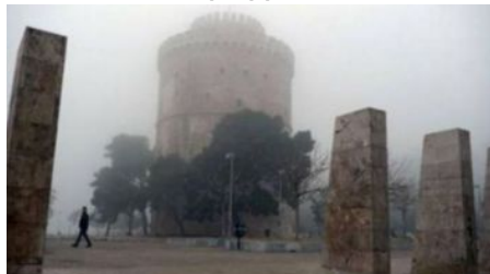
Έκτακτα μέτρα μετά από 5 ημέρες αιθαλομίχλης