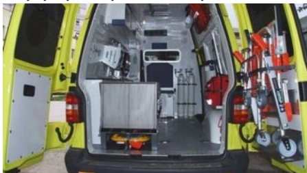
Νεκρός σε τροχαίο