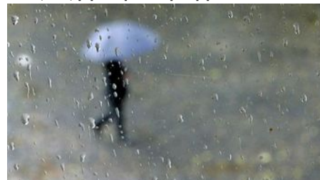
Βροχερός καιρός στη Θεσσαλονίκη