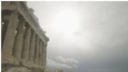
Ο καιρός σήμερα