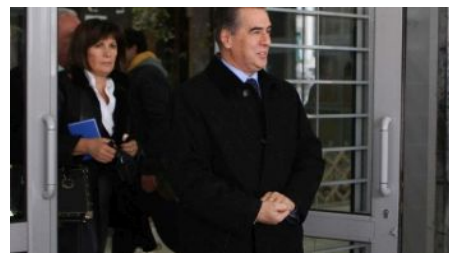
Σε εξέλιξη η δίκη Παπαγεωργόπουλου