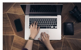
Νέες ταυτότητες: Τέλος οι επισκέψεις στα ΚΕΠ - Εξουσιοδοτήσεις με ένα... κλικ από τον υπολογιστή