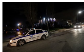
Φονικό στην Κρήτη : Το οικογενειακό δράμα πίσω από τη δολοφονία του 59χρονου