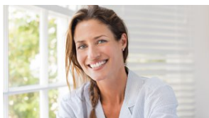
Έχεις καλά γονίδια; Είσαι τυχερή, αλλά ακόμη και αυτά χρειάζονται το... boost τους