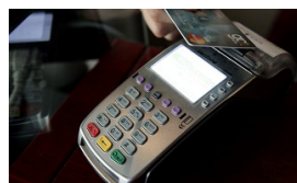
Αφορολόγητο: POS.. θα χτίζεται από το νέος έτος - Οι αποδείξεις που μετράνε στην Εφορία