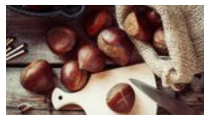
Κάστανα, χρήσιμες συμβουλές για την επιλογή, τη χρήση και τη συντήρησή τους